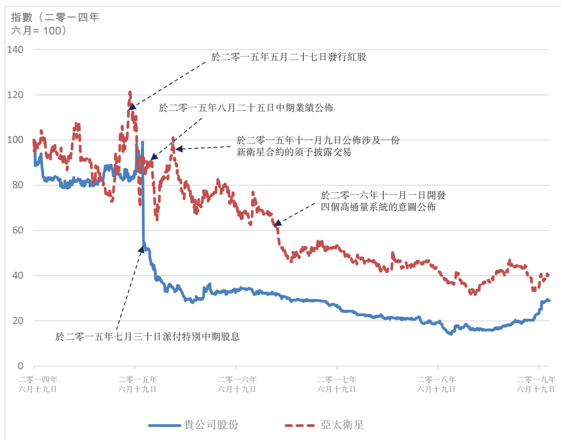
圖二 – 股份於過往5年相較於亞太衛星的表现